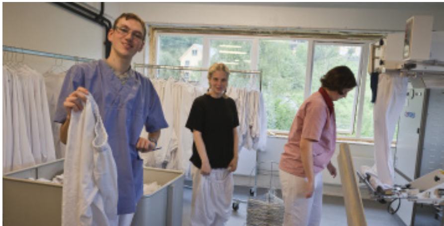
I vaskeriet jobber arbeidstakere for å få unna dagens vaskeoppdrag.