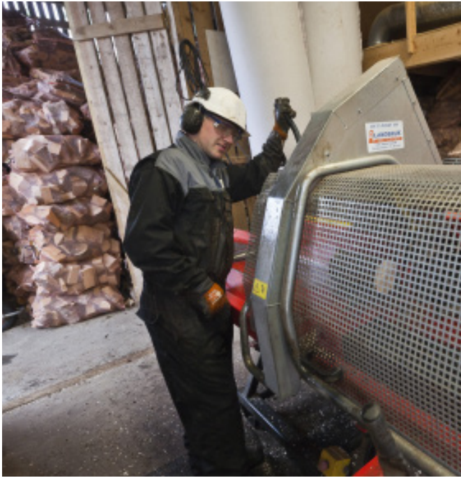
Ved kappes og klargjøres ved Storeholmen.