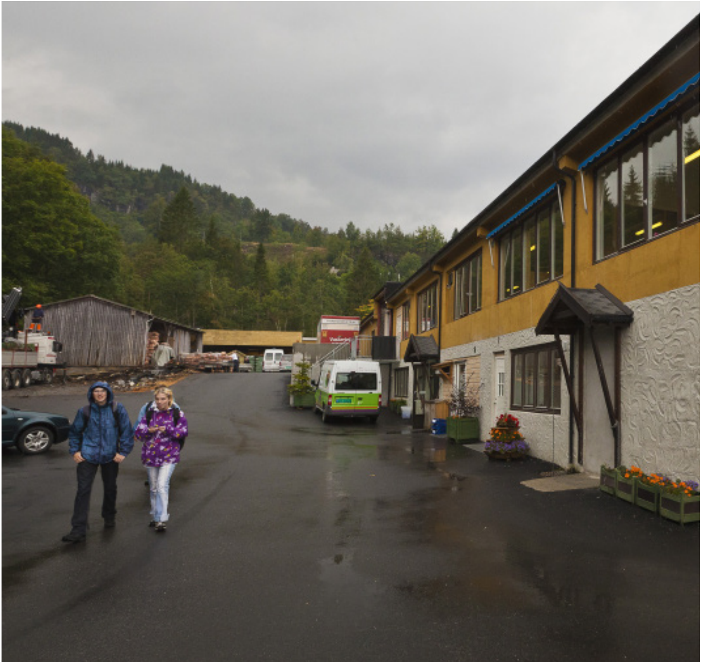
Den vernede bedriften Storeholmen ligger midt i Øystese.