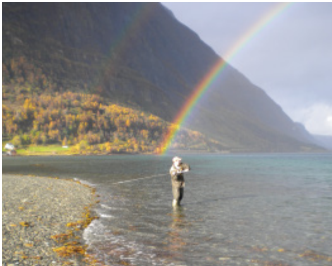
Fiske i flotte omgivelser.